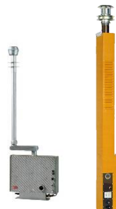
Alde Värmepanna 2700 (1966) och 2921 (1977)