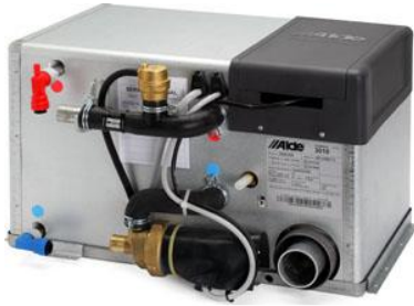
Alde Värmepanna Compact 3020HE (2006)

1993 lanserades den första generationen av Alde Compact-pannorna. Det var en förfrågan från en tysk husbilskund som önskade en värmepanna som kunde installeras i mellangolvet. Resultatet blev Alde Compact 3000 som blev årets branschnyhet 1994 och som också banade väg för en stark utveckling och internationell expansion. Compact-pannorna har fortsatt att utvecklas och idag är det den tredje-generationen; Alde Compact 3020 HE, som produceras i Färlöv.